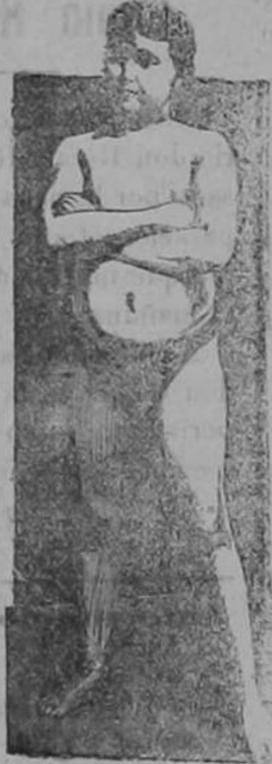
EDAD 11 AÑOS

La transformación maravillosa de un ser endeble y raquítico en un adolescente fuerte, robusto y sano, como lo demuestra su atlética figura, fué obra realizada por la